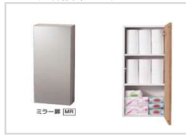
ミラー収納 埋め込み収納