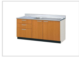
セパレートキッチン