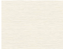
壁: 金属サイディング