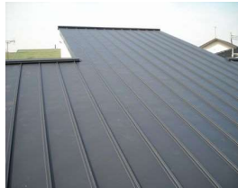
屋根: ガルバリウム鋼板